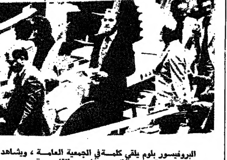
البروفيسور بلوم يلقي كلمة في الجمعية العامة، ويشاهد في اسفل الصورة بعض المتدربين يقادرون القاعدة

مقر الأمم المتحدة - وكالات - أعلن امس البروفيسور يهودا بلوم